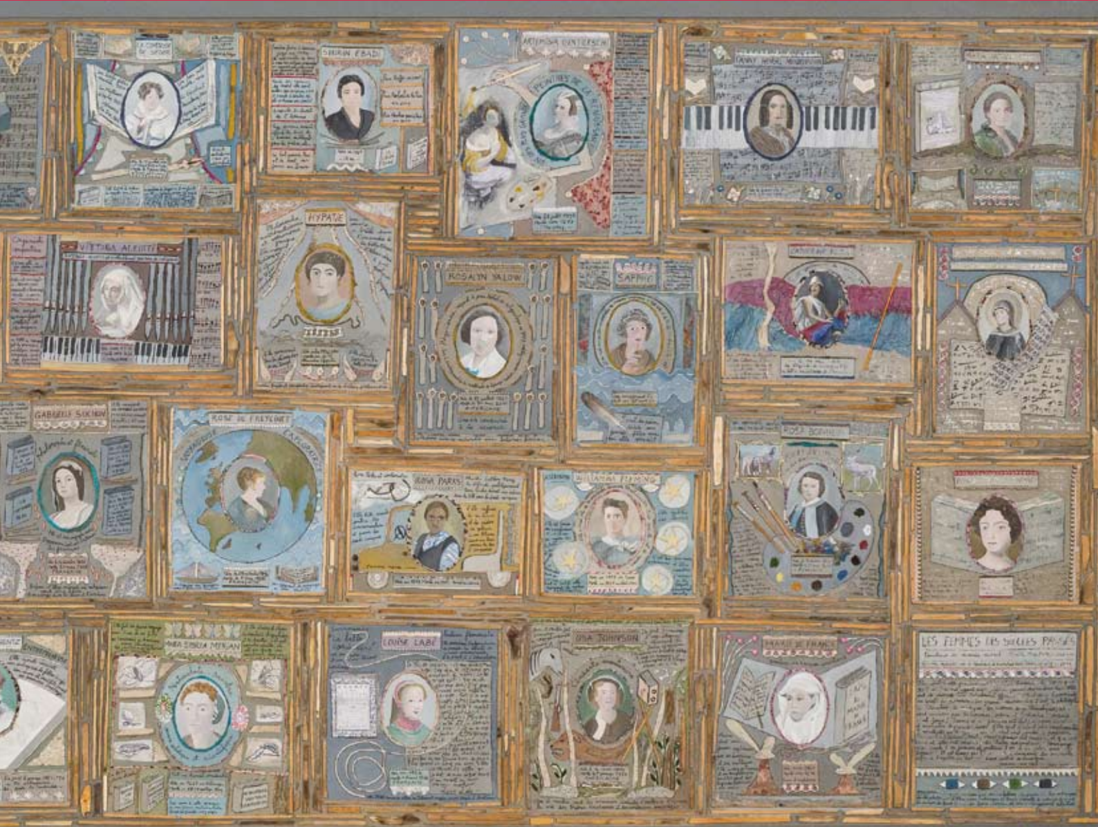
Détail du panneau n°1

Peinture de Marie Morel, composée de 5 panneaux, l'ensemble mesure 15 mètres de long. Quatre cents femmes sont présentées.